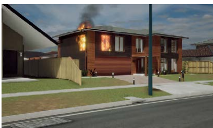
Incendies de maison

L'équipe FLAIM a développé un moteur avancé de simulation de fumée et d'incendie qui permet au modèle G-RSTV d'être correctement mis en pratique dans les scénarios de la bibliothèque qui connaît une croissance rapide. Les scénarios utilisent les dernières technologies de jeu afin qu'ils soient visuellement très réalistes et fonctionnent avec une fréquence d'images optimale (fréquence d'images). Le FLAIM After Action Review (AAR) fournit des informations sur l'utilisation des agents d'extinction et de l'air et (dans un proche avenir) également des données biométriques telles que la fréquence cardiaque.