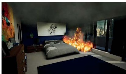
Immeuble Grande hauteur