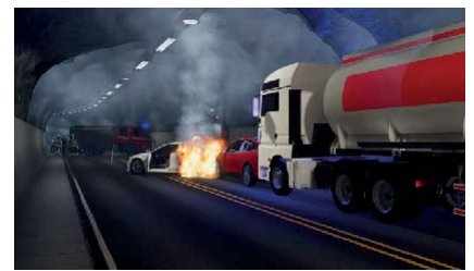
Incendies de transport