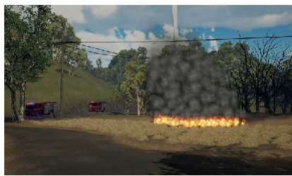
Feux de forêt